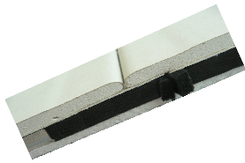
Deckeninnendämmung: Beispiel Detail 4.8.